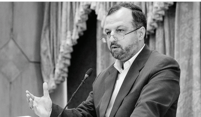
عاملیت و اعتبارسنجی در کشور هستیم و نوع و الگوی اعتبار سنجی در سطح کشور

وی ادامه داد: اولین خروجی این شورا، آیین‌نامه صندوق‌های تضمین است و دومین آیین‌نامه‌ای که در دست شورا است، آیین‌نامه اعتبارسنجی است. ما به دنبال ارتقای نهاد